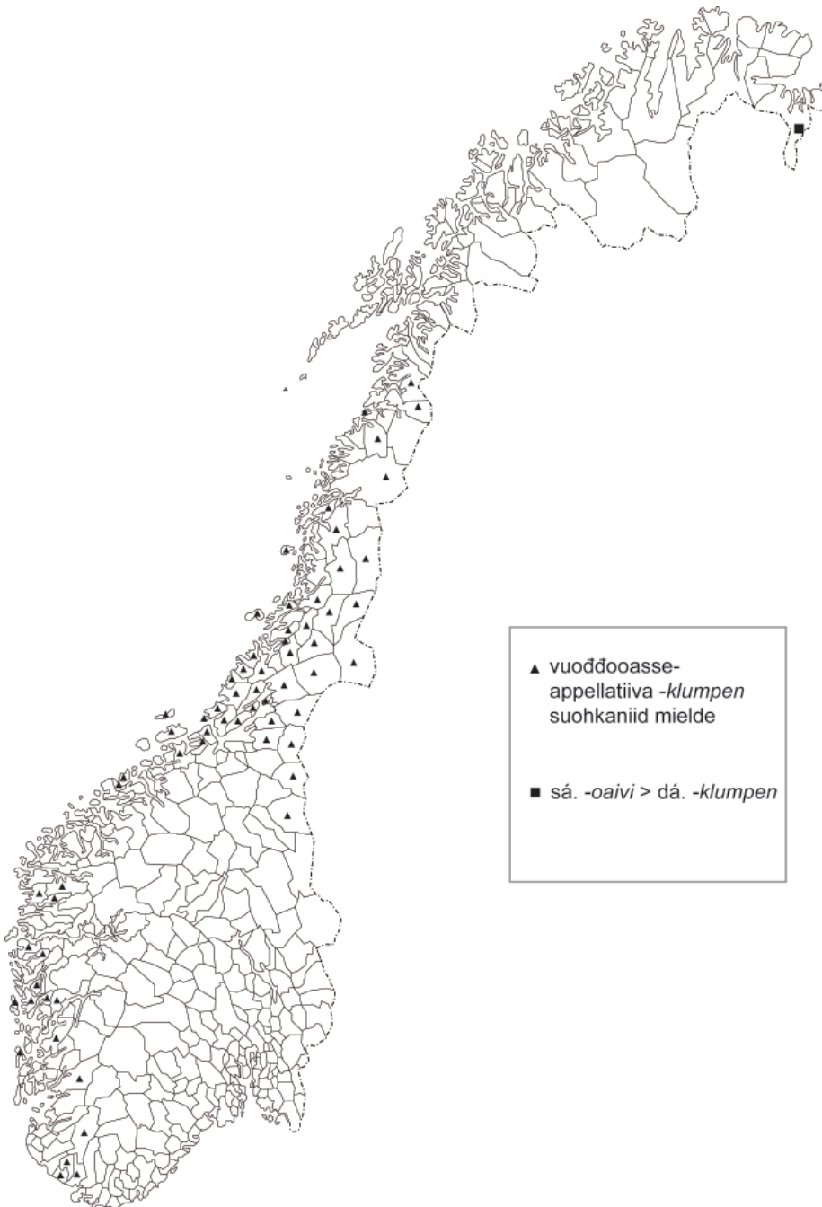
Kárta 1. -klumpen vuoddoasseappellatiivan álbmotlaš nammabidjamis gitta Nordlánda rádjai (SSR mielde). Máttá-Várjjaga -klumpen -loahpasaš namat leat jorgaluvvon -oaivi -appellatiivva vásttan 1800-logu loahpas grádamihkkokártabargguin, iige dáin -klumpen -loahpasaš namain leat dan dihte álgoálggus makkárge vuoddu njálmmálaš gielas.